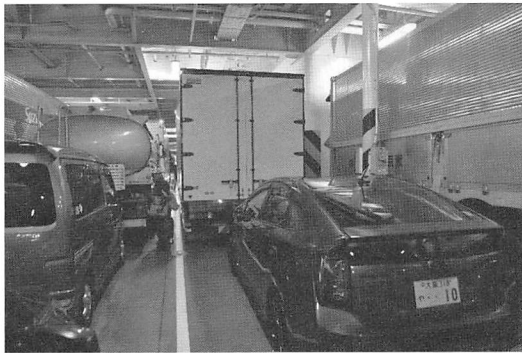
ぎっしりと積まれた大型車の間に乗用車をとめている「やまと」の車両甲板

で理解ができた。そこには大型車が隙間なしにぎっしりと積載され、その大型車の間にできた空間に乗用車をうまく嵌め合わせるように駐車させていた。車をでてから客室へ上るためのエレベータホールに辿り着くためには、大型車の間の狭い隙間を、時には蟹のように横移動して通らなくてはならず、これで同乗者を別に乗船させている理由が理解できた。モータルシフトとトラックドライバー不足の追い風で、長距離カーフェリーの輸送実績は絶好調なのが実感できた。